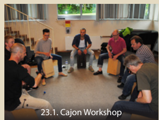
23.1. Cajon Workshop