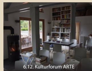
6.12. Kulturforum ARTE