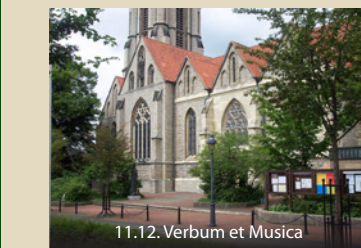
11.12. Verbum et Musica