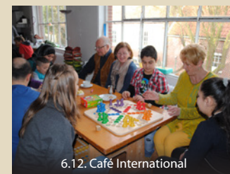
6.12. Café International