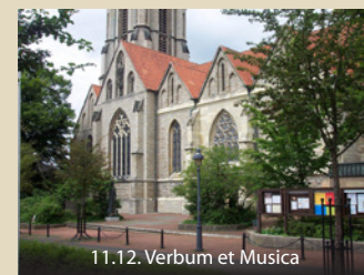
11.12. Verbum et Musica