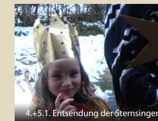
4.+5.1. Entsendung der Sternsinger